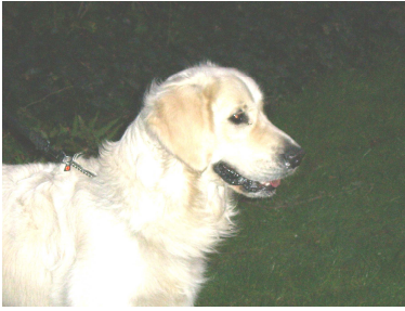
Onze Willy, Inmiddels 1 3 maanden oud en bijna afgestudeerd bij Hachiko

“We moeten weigeren ons door de stroom te laten meesleuren. Wie verdrinkt kan de anderen niet redden” Mahatma Ghandi