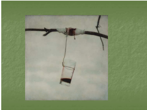
Respect voor alle leven kan soms beter met symbolen dan met woorden worden uitgelegd..